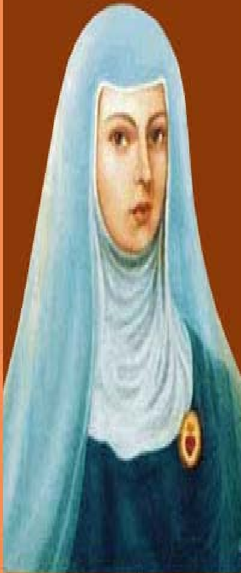
JOANNA DE ÁNGELIS

“A tarefa da psicologia espírita é tornar-se ponte entre os notáveis contributos dos estudos ancestrais dos eminentes psicólogos, oferecendo-lhes uma ponte com pensamento spiritista, que ilumina os desvãos e os abismos do inconsciente individual e coletivo, os arquétipos, os impulsos e tendências, os conflitos e tormentos, as aspirações da beleza, do ideal, da busca da plenitude como decorrência dos logros íntimos de cada ser, na larga escala reencarnacionista. ”